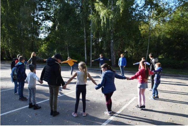
Parka gelen çocuklarla oyun molası.