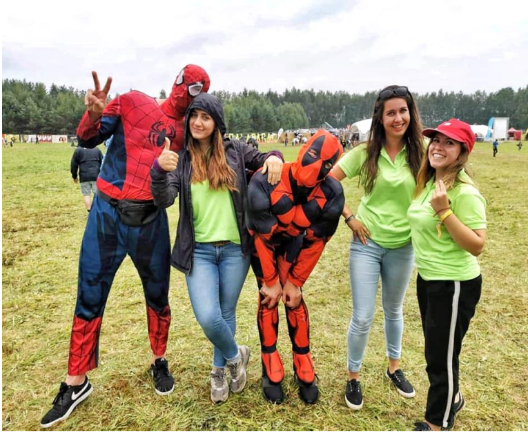
Sponsoru olduğumuz bir festivalden bir kare