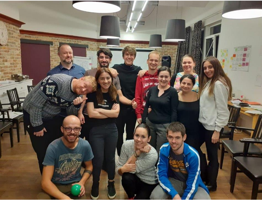
Estonya Ulusal Ajansının varış eğitiminden.