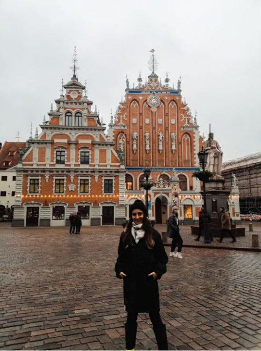
Letonya'nın başkenti Riga'dan!