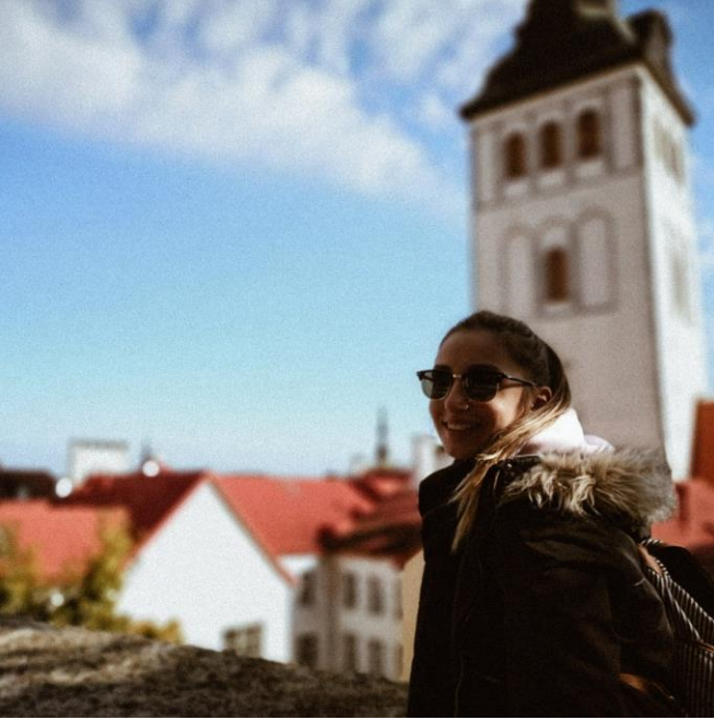
Tallinn'de herhangi bir gün!