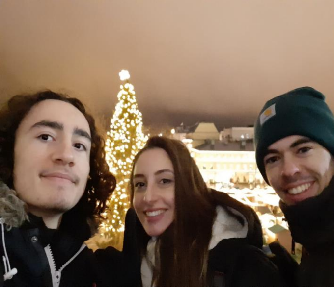
Fransa ve İspanya'dan diğerk gönüllülerle Helsinki'den!