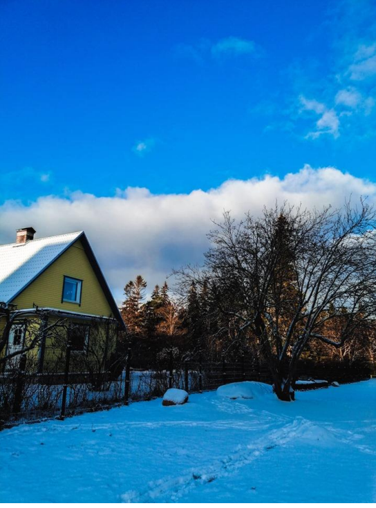
Anaokulumun bahçesi /Kış