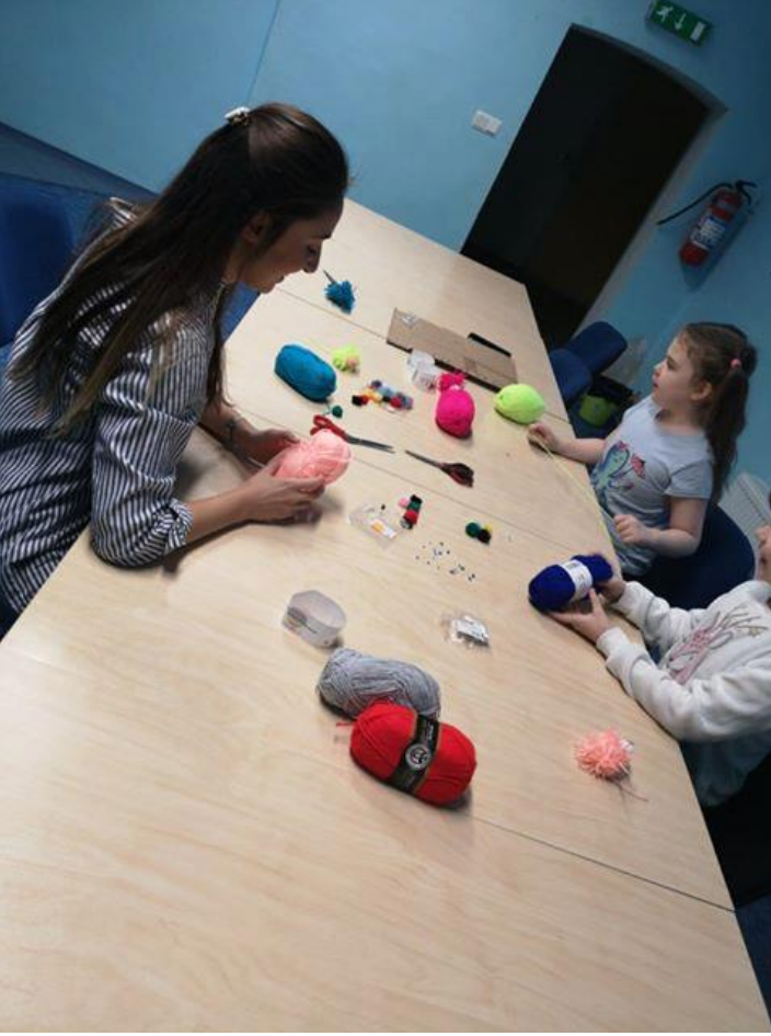
Gençlik merkezindeki küçük yaş gruplarından çocuklarla yaptığımız el işi etkinliklerinden biri.