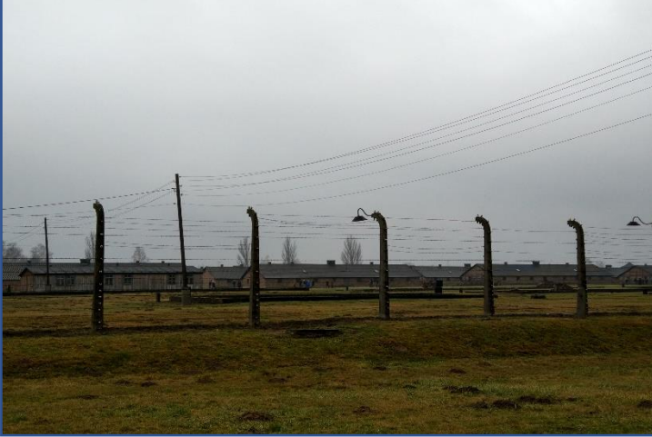
Auschwitz Ölüm Kampı