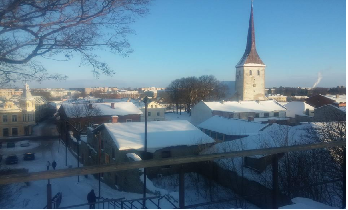
Otelimizin bulunduğu Rakvere den bir görüntü ☺