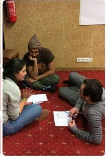
Eđitimimizden bir fotođraf derlemesi yaptım....