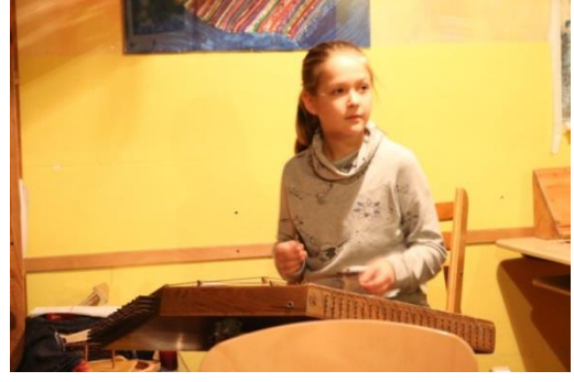
(Santur dersi verdiğim öğrencim)

Mesela çocuklarla bir aydır haftanın üç günü her gün normalde 4 çocukla beraber 'Aladdin Stadt' adını verdiğim bir mahalle maketi yapıyorum çocuklar bayılıyor. Bauhaus'dan aldığım kocaman kartonu dörde böldüm ve çocukların eline -tabi öncesinde tehlikesini ve uyarıları söyledikten sonra- sıcak silikon ve hazır kesilmiş tahtaları ve bir sürü elinizde artık ne varsa verin çocuklar kendi hayal dünyalarına göre o kartonu şekillendirsinler. Hem çok yaratıcı hem çok eğlenceli. İşte orada çatısına helikopter koymak isteyeneye ayrıca helikopter yapmak ya da garajına arabasını koymak isteyeneye araba yapmak, itfaiye arabası isteyen mi dersin şehrin ortasına süslü bir ağaç isteyen mi. Tabi her şeyi çocuklarla beraber yapmak gerekiyor yani görmeleri gerek yardım etmeleri gerek ve fikir konusunda açık olmak gerek. Mesele bir şey yaparken onu böyle yapalım dediğinde çok itiraz etmemek gerek. Bırakın bozuk olsun kötü olsun ama kendisi onun farkına varsın. Tabii ki de çocukların en sevdiği şey soru sormak. Çok soru sorarlar ve liften ama liften detaylıca sorularını cevaplandırın sakın kısa kesmeyin ya da dikkate almamazlık yapmayın. Evet onlar bence bir şeyler öğreniyor ama emin olun ben onlardan daha çok şey öğreniyorum. Bir arkadaşım bana sürekli 'Apo sen küçüklüğünü yaşıyorsun'. diyor.