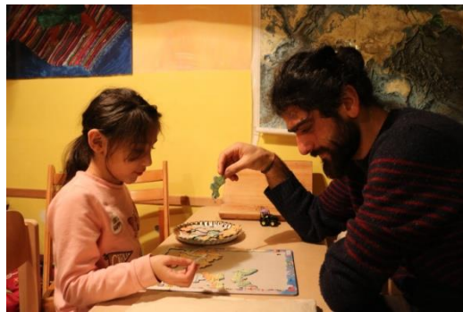
(yaptığımız bazı etkinliklerden)

Aklıma gelen her şeyi onlarla yapmaya çalışıyorum. Kendi düşündüğüm projeler dışında ayrıca küçük sürprizler de yapmak gerek oyun ve oyuncaklar hakkında mesela evi yaparken