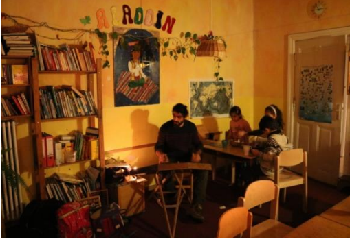
(Cuma günleri verdiğim konserlerden bir kare)