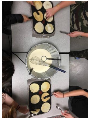
Öğrenciler benim için krep gecesi düzenlediklerinde