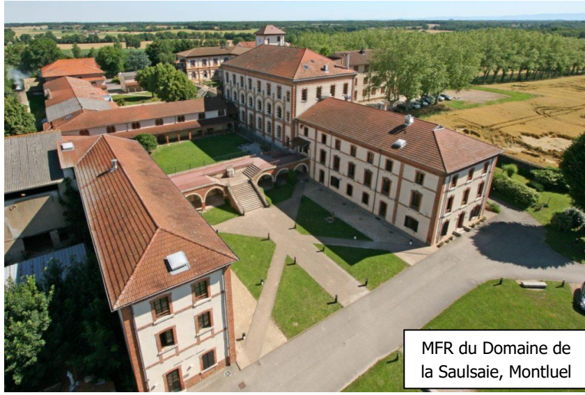
MFR du Domaine de la Saulsaie, Montluel

Projemden bahsedecek olursam; Fransa'nın birçok bölgesinde MFR isimli meslek edindirmeye yönelik yatılı liseler bulunuyor. Bu kurumlar genelde şehirden uzak, kırsal alanlarda oluyor. Benim çalıştığım okul olan MFR du Domaine de la Saulsaie ise Lyon'a sadece yarım saat uzaklıktaki Montluel adlı kasabada bulunuyor. Lyon'a varışından bir hafta sonra, mentörüm ile çalışacağım okulun olduğu kasabaya doğru yola çıktık. Vardığımızda ordaki 2 koordinatörümle tanıştım ve okulla, projeye, kalacağım yer ve öğrenciler ile ilgili bir toplantı yaptık. Beni okula getiren mentörüm ayrıldıktan sonra MFR'deki koordinatörlerim bana okulu gezdirdi, tek tek sınıflara girip öğrencilerle tanıştırdı ve kalacağım yeri gösterdi. Bu proje kapsamında, benim çalışma günlerim Pazartesi sabahından Perşembe akşamına kadar. Bu süreçte okul bahçesi içindeki bir evde kalıyorum; Cuma ve hafta sonları için ise Lyon şehir merkezindeki evime dönüyorum. Bu projedeki görevim, okuldaki İngilizce öğretmenlerine yabancı dil konusunda destek olmak ve öğrencilerin farklı kültürlerle tanışık olmasına yardımcı olmak. Bu yüzden ders planı hazırlarken öğretmenlere yardım etmenin yanı sıra akşam yemeğinden sonra da öğrencilerle kaliteli vakit geçirebilmek için onlara farklı aktiviteler, oyunlar, farklı ülke sunumları, konuşma kulüpleri ve dans geceleri gibi etkinlikler sunuyorum.