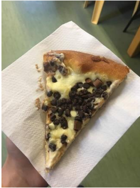
Öğretmenlerin yaptığı kutlamadan bir kesit

Hem çalıştığım okuldaki hem de koordinatör kuruluşumdaki herkes çok yardımsever ve sıcakkanlı. Daha şimdiden bir aile gibi olduk diyebilirim. Örnek vermek gerekirse, hem öğrenciler hem de öğretmenler, okuldaki ikinci günüm olmasına rağmen bana bir doğum günü ve hoş geldin kutlaması yaptılar. Aynı hafta sonu koordinatör kuruluşum da benim için bir kutlama yaptı ve bu kurumdaki diğer gönüllülerle tanışma fırsatım da oldu.