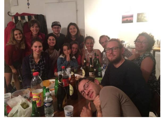
Koordinatör kuruluşumun yaptığı doğum günü + hoş geldin partisi