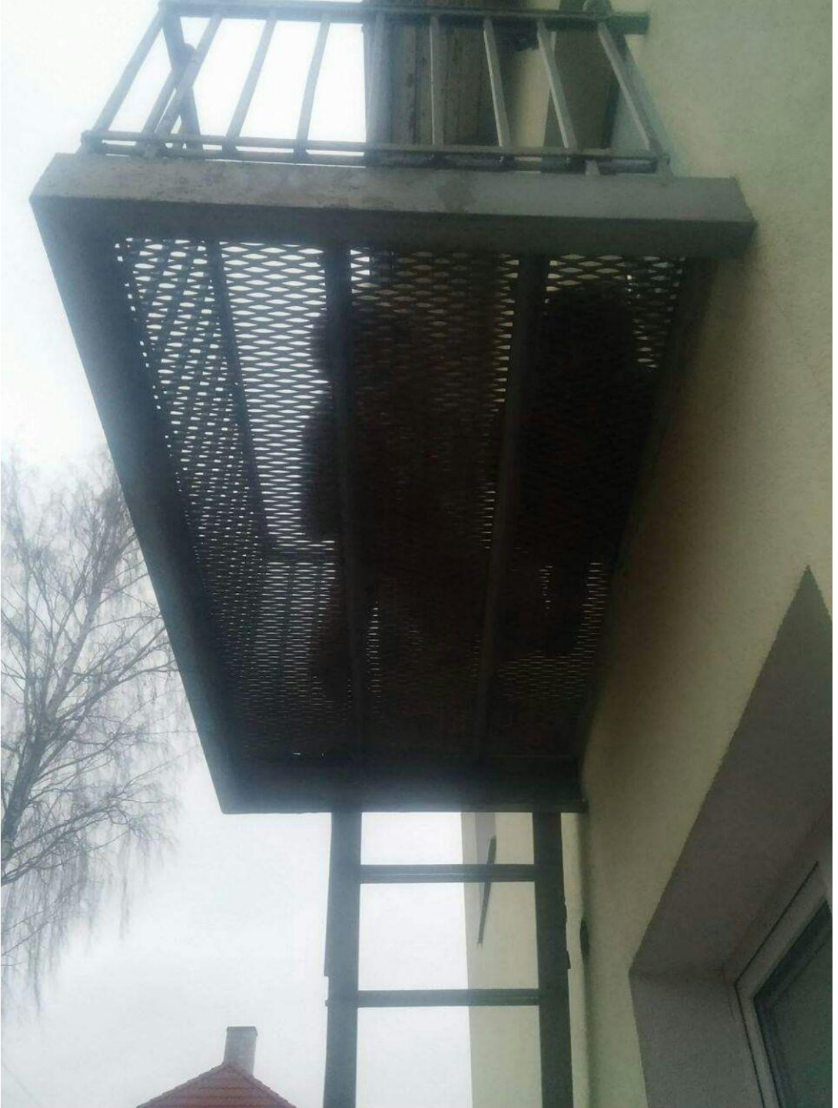
Saklambaç oyunumuzdan bir kare:D