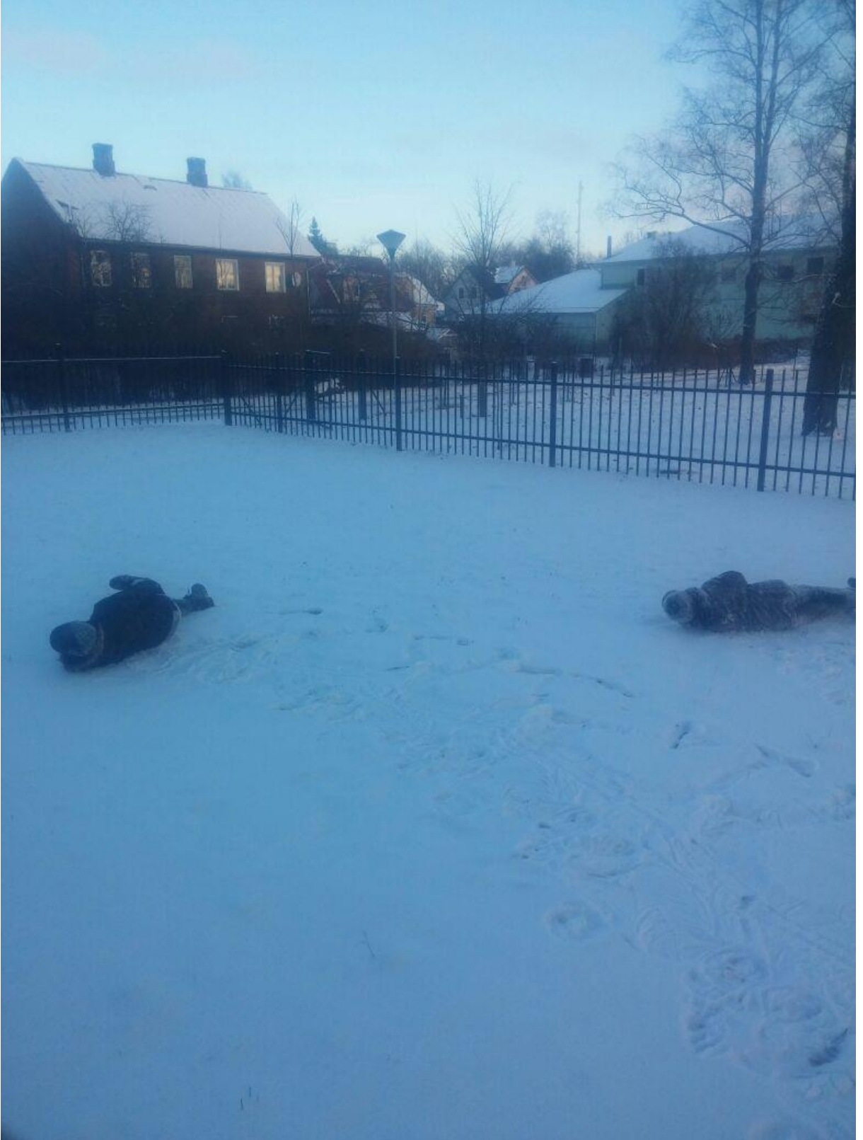
Karda yuvarlanarak yarış oyunumuzdan :D