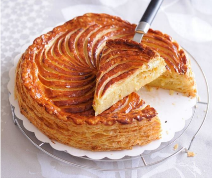
Galette des rois

Bu gün sadece Polonya'da kutlanan özel bir gün değil. 2 Fransız ile birlikte yaşıyorum ve onlar da bu günü kutladı. Fransa'da bu gün "Galette des rois" denilen bir çeşit kek yenilerek kutlanıyor. Ev arkadaşlarım ve kordinatörümüz ile birlikte bu keki yapmaya karar verdik. Çok eğlenceliydi. Kek yapılırken içine erimeyecek bir nesne konuluyor ve kek kesilirken bir kişi masanın altına girip, kesilen dilimin kime gideceğini söylüyor.